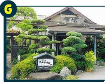
G 宝家 お食事券3,000円分 2名様