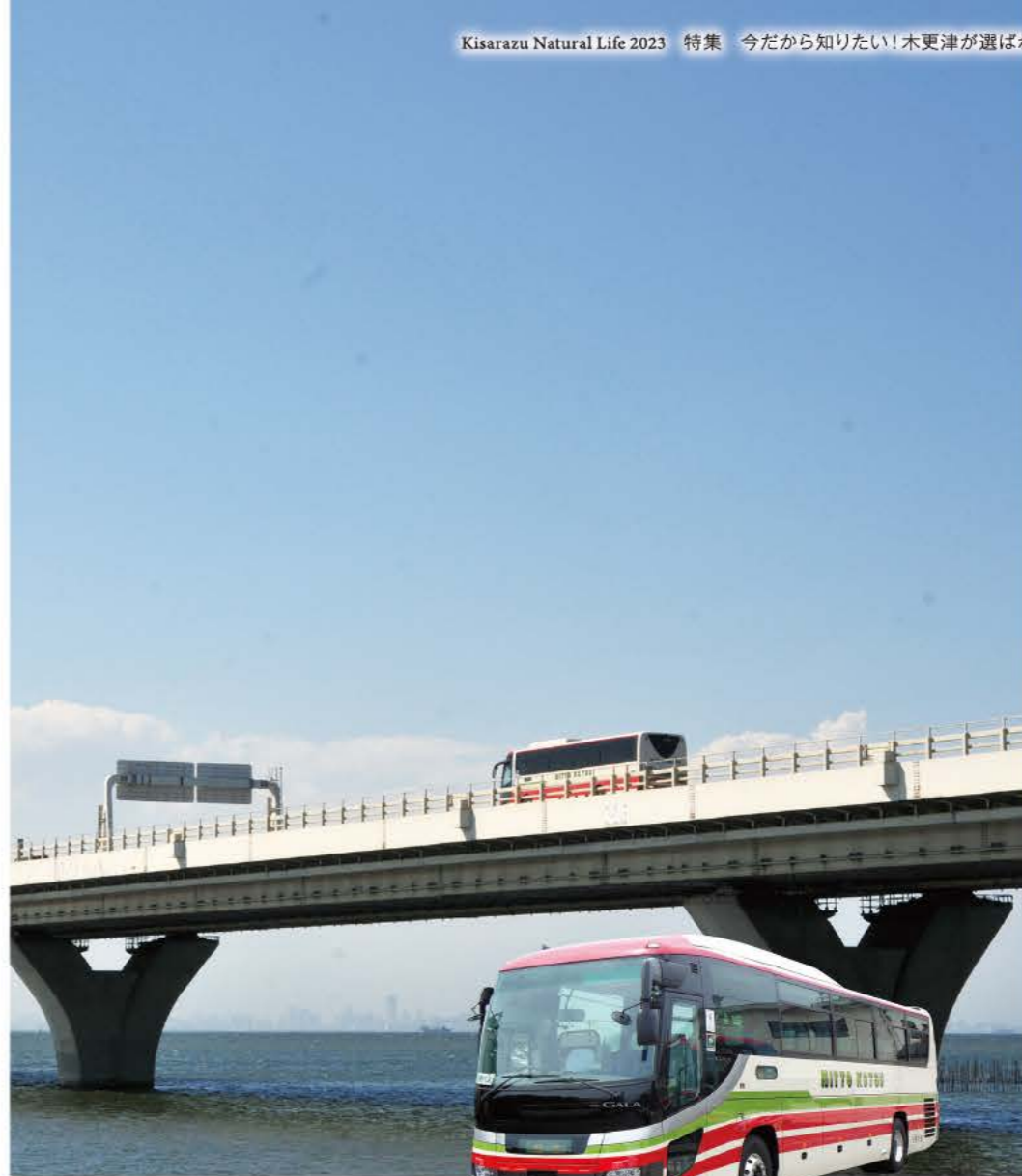
協力:日東交通株式会社