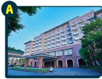
A オークラ アカデミアパーク ホテル ベア宿泊券 1組2名様 スーベリアルーム1室2名様/朝食付き ※有効期限 2024年6月末日

「木更津ナチュラルライフ」はいかがでしたか？移住・定住に関する取組の参考にするため、移住や「木更津市」について感じている事をお聞かせいただきたいので下記リンク先のアンケートにご協力をお願いします。