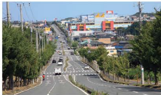
木更津ほたる野 買い物に便利な、新しい住宅が立ち並ぶエリア