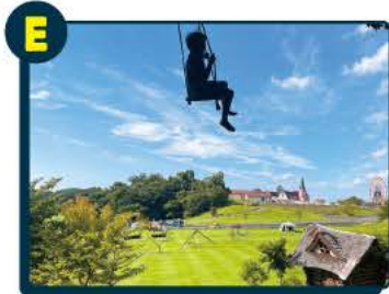
E 東京ドイツ村 招待券 5名様 ※一枚で乗用車1台分最大10名様・車以外 1グループ5名様まで