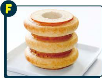
F ザ・フィッシュ見波亭 のごり山バウムクーヘン3山 5名様