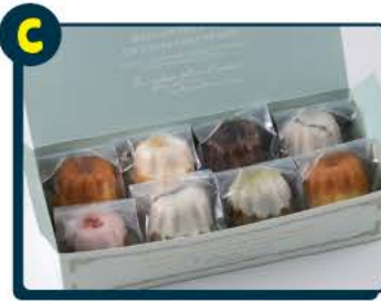
C せんねんの木 木更津駅西口店 カヌレ×カステラ タヌキのおへそセット 5名様