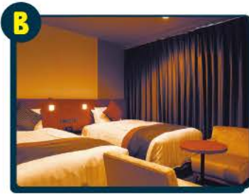
B 木更津ワシントンホテル ベア宿泊券 2組4名様 ※有効期限 2024年6月末日