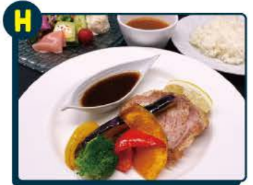
H 鹿野山ビューホテル ランチお食事券1,980円分 3名様 要予約 ※有効期限 2024年5月末日