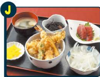
J 食事処 やまよ お好きな定食 5組10名様