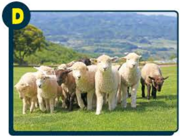
D マザー牧場 ベア入場招待券 10名様