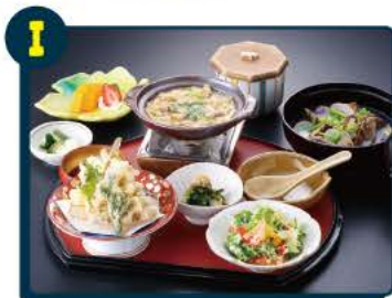
I 東京ベイプラザホテル ランチ券(アサリ御膳) 5組10名様