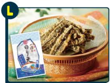
L 特定非営利活動法人 木更CoN 一途なり天(2袋入) 10名様