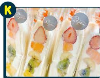
K スイーツ Pergolato(ベルゴラート) フルーツサンド 10名様 お店で好きな品をお選び頂けます